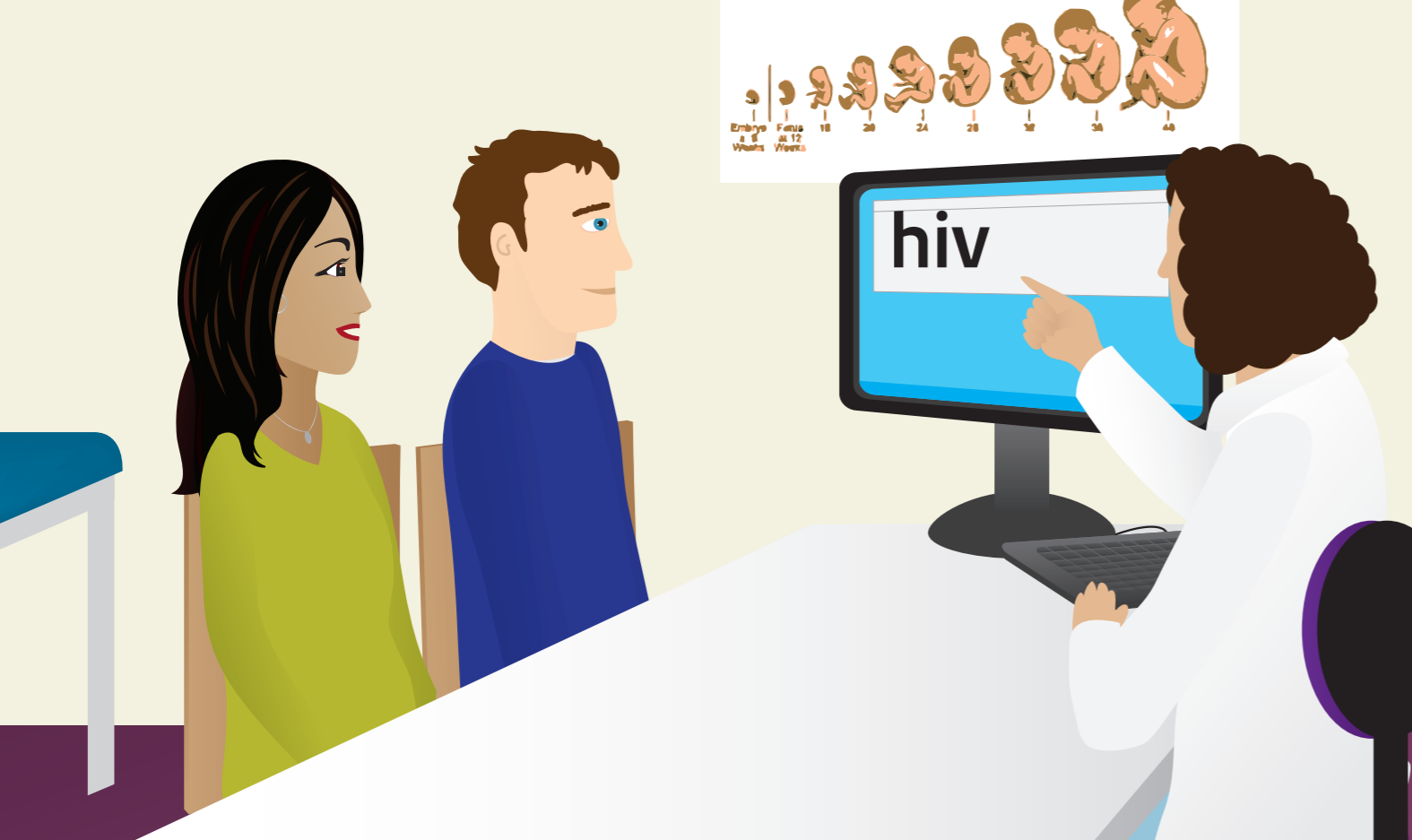
De verloskundige vertelt wat hiv is