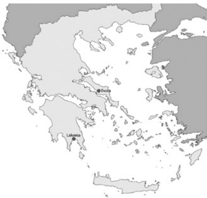
Figuur 1 Geografische spreiding van de bevestigde gevallen van R. vivax in Griekenland in de periode juni t/m augustus.

Negen personen liepen vanaf half juni een